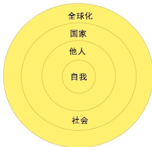
公民教育课程架构表

来，让学生认识“社会”，关心社区与文化差异、普世人权，并了解何谓“国家”，民主与法治精神、参与公共议题。最后认识全球化社会议题，做一个负责的地球公民。